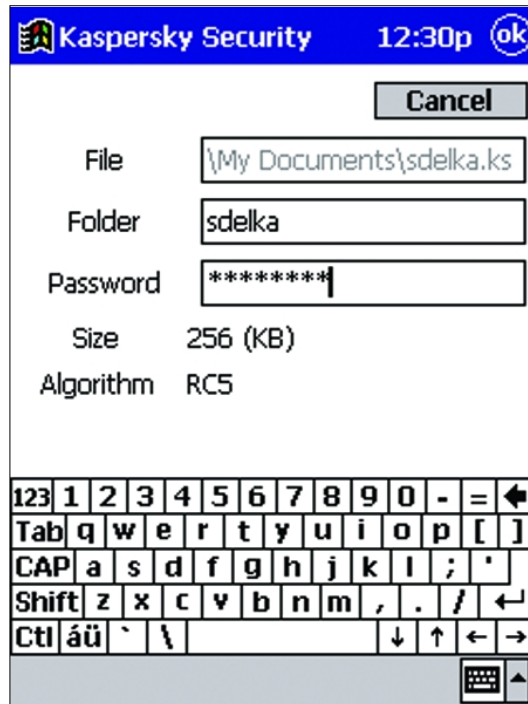
Datenschutz durch Passwörter

Kaspersky® DataSafe für Windows CE bietet auch Schutz für vertrauliche Daten des Taschencomputers unter Windows CE gegen unautorisierten Zugriff. Das Programm erstellt geheime Verzeichnisse, in denen Daten verschlüsselt und passwort-geschützt werden. Diese Verzeichnisse können auf dem Taschencomputer oder auf der Speicherkarte angelegt werden.